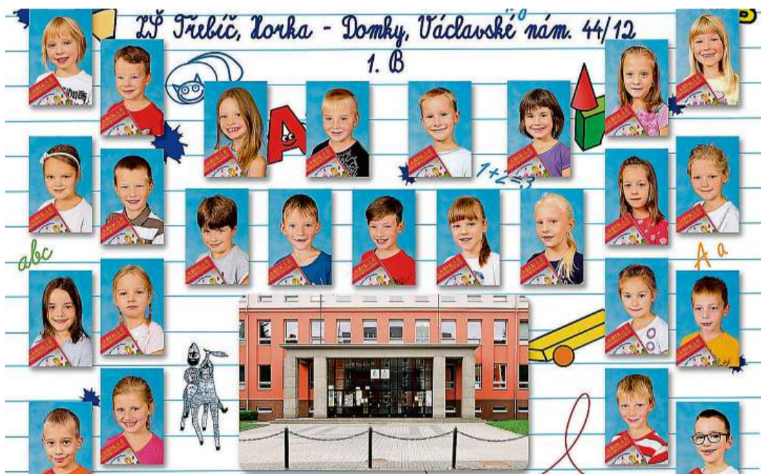
ZŠ Třebíč, Horka-Domky, Václavské nám. 44/12