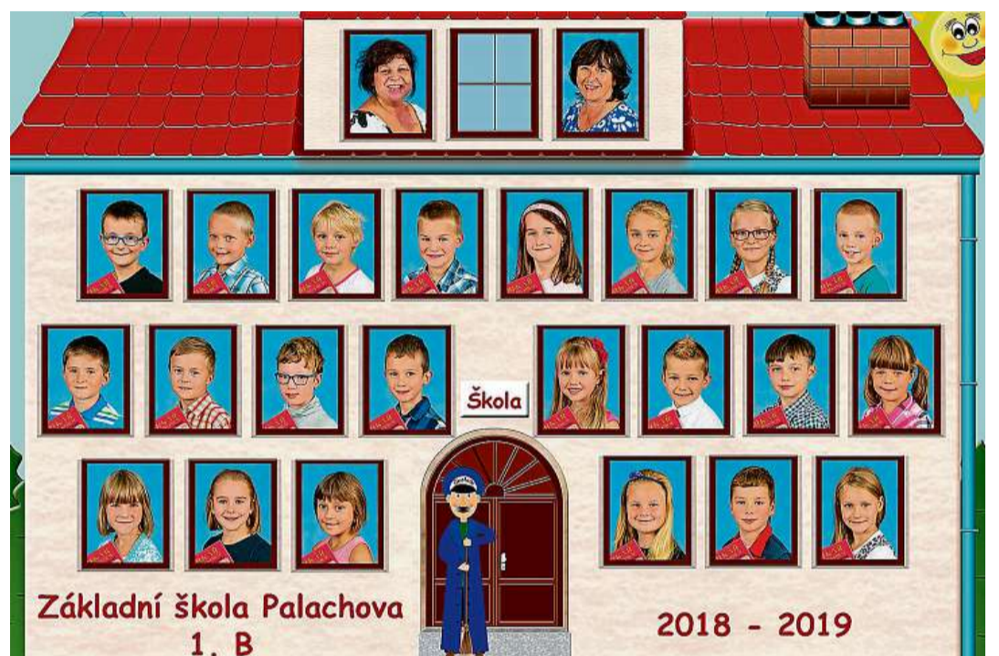
ZŠ Žďár nad Sázavou, Palachova 2189/35, přísp. org.