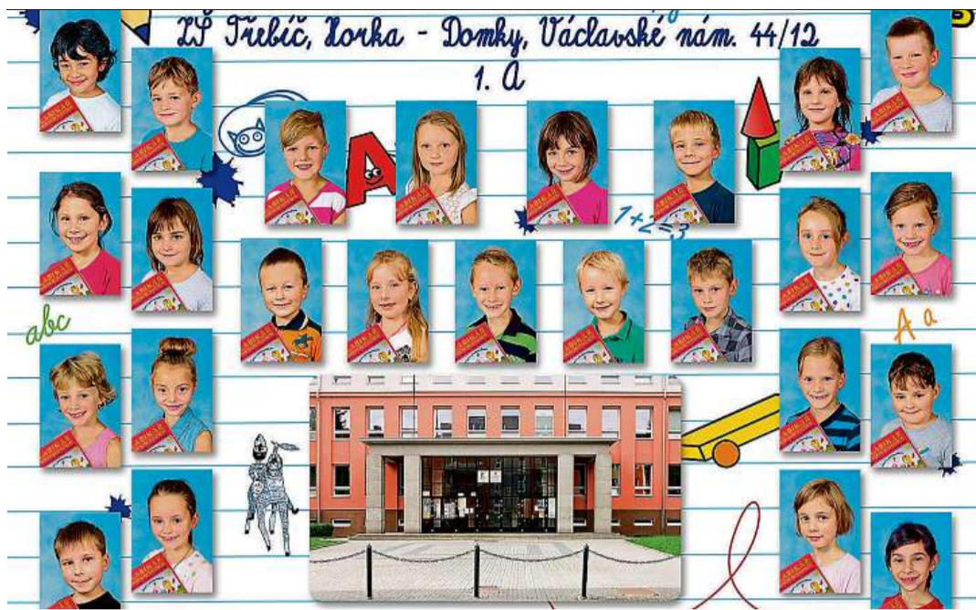
ZŠ Třebíč, Horka-Domky, Václavské nám. 44/12