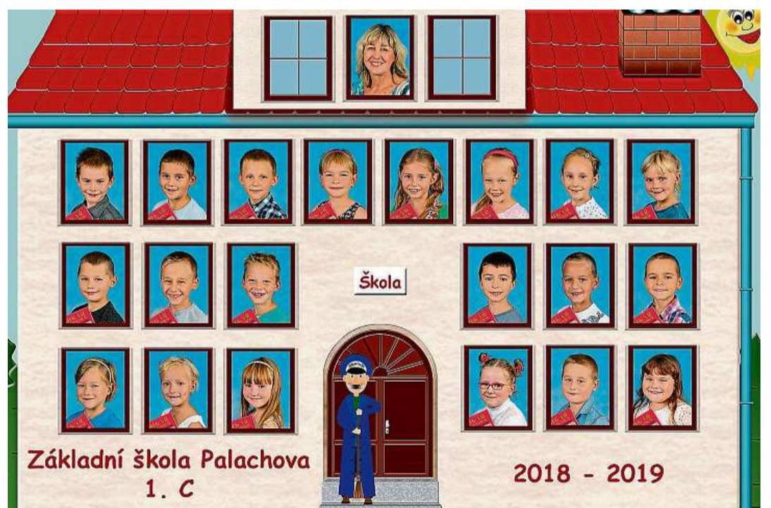
ZŠ Žďár nad Sázavou, Palachova 2189/35, přísp. org.