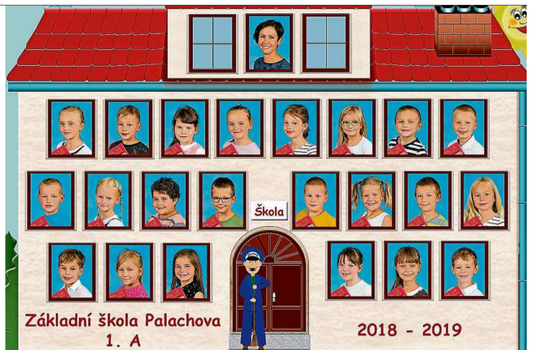
ZŠ Žďár nad Sázavou, Palachova 2189/35, přísp. org.